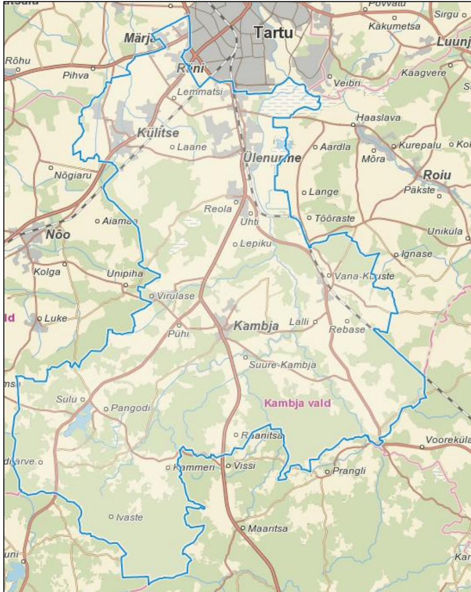
Joonis 1. Kambja valla haldusterritoorium.

ÜP eesmärk on kogu Kambja valla territooriumi (Joonis 1) ruumilise arengu põhimõtete ja suundumuste määratlemine.