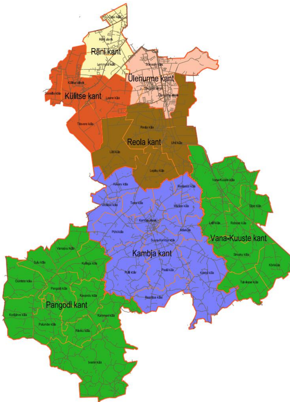
Kaart 1. Kambja valla piirid ja külad