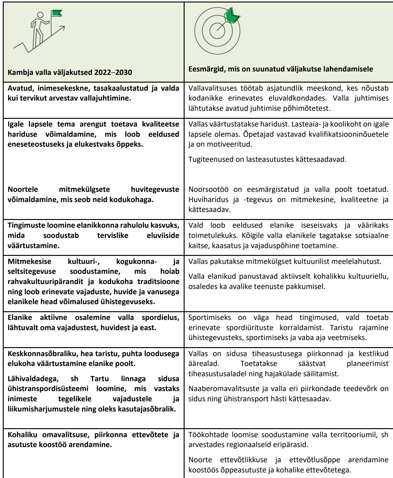
Tabel 2. Kambja valla eesmärgid ja väljakutsed 2022–2030